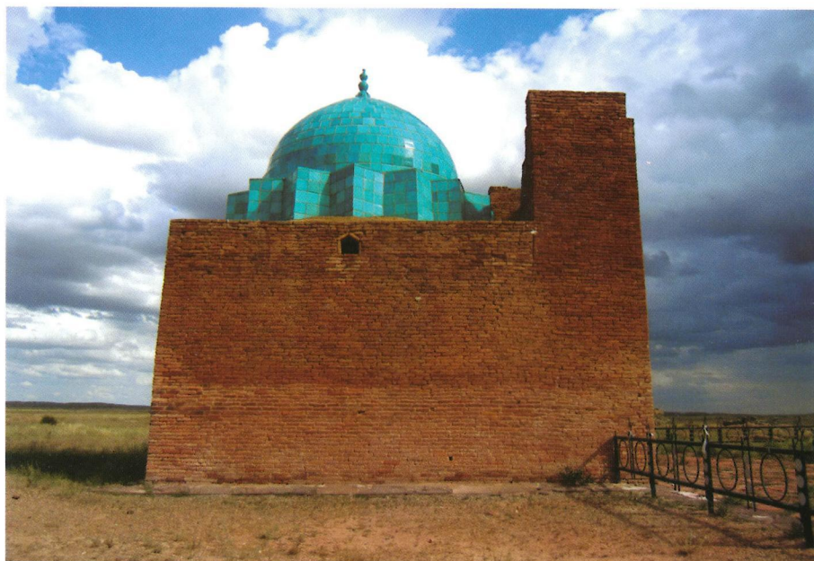
Рис. 2. Мавзолей Жоши-хан после реставрации. Северо-западный фасад. 2007 г.