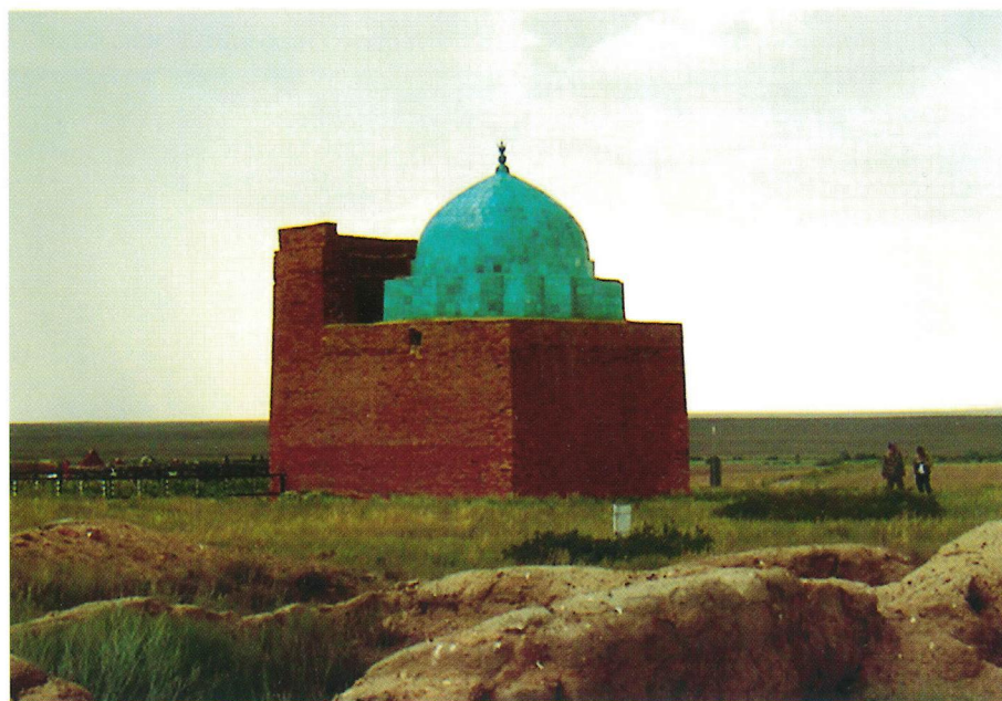
Рис. 4. Остатки дома из сырцового кирпича рядом с мавзолеем Жоши-хан. Вид с востока. Фото Е. Х. Хорош. 2007 г.