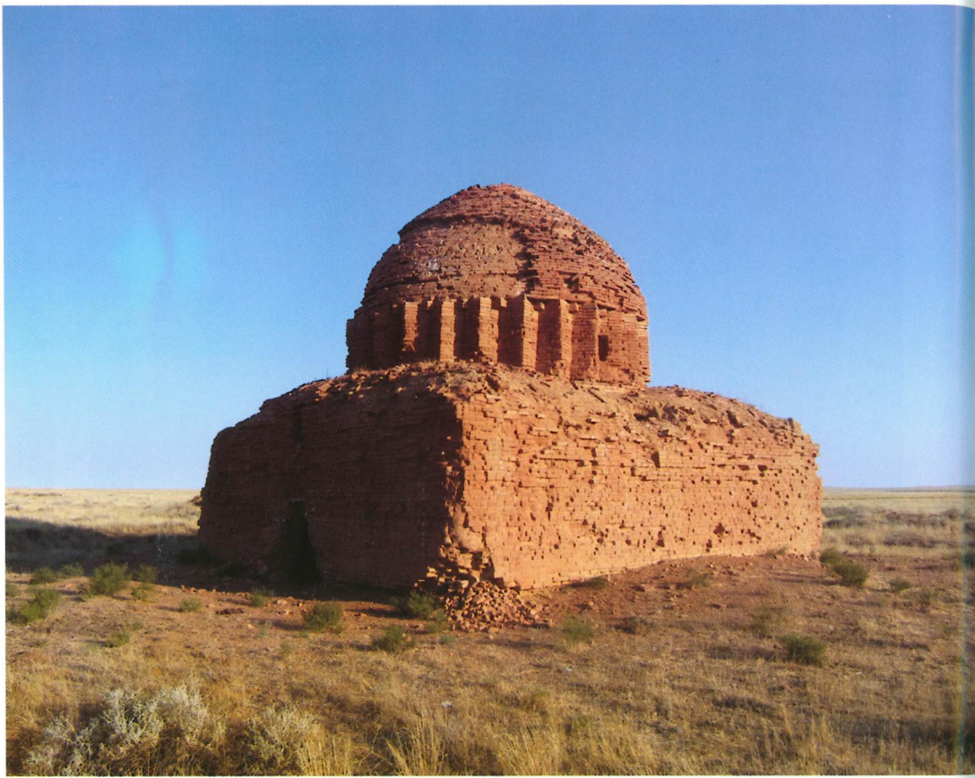
Рис. 6. Мавзолей Оналбек-ата. XIX век (Актюбинская обл., Шалкарский р-н).