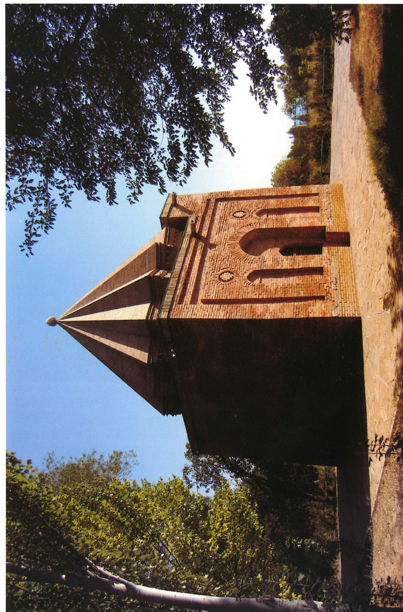
Рис. 5. Мавзолей Бабаджи-хагун. XI век (Жамбылская обл., с. Айшаблiн). 2007 г.