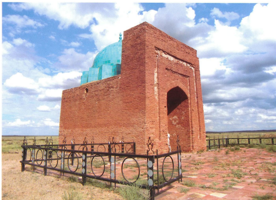
Рис. 1. Мавзолей Жоши-хан после реставрации. Вид с запада. Фото Е. Х. Хорош. 2007 г.